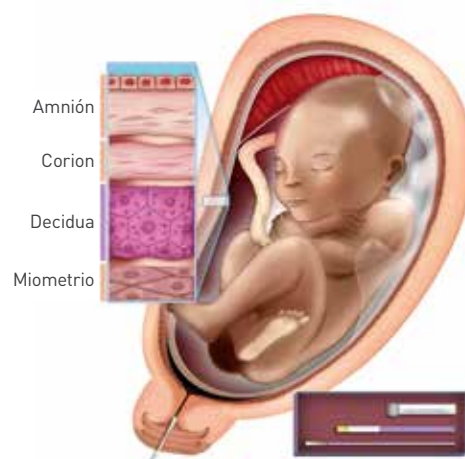
FIGURA 1. Actim Partus identifica el riesgo de parto prematuro mediante una simple toma de muestra cervical por hisopo.

La evidencia clínica de numerosos estudios indica que Actim Partus tiene un valor predictivo negativo (VPN) muy elevado (98%) , de modo que es una herramienta confiable para descartar riesgos de parto inminente (tabla 1) o prematuro (tabla 2).